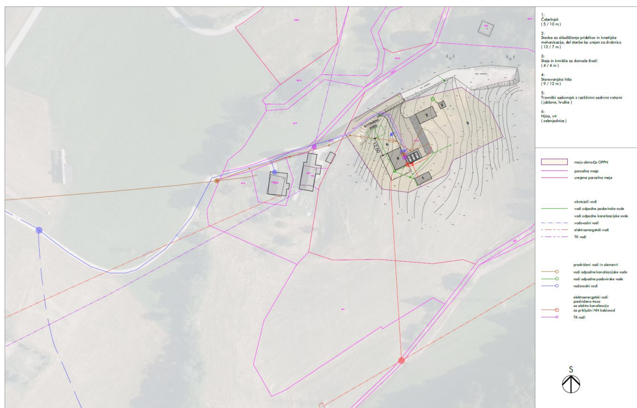
Slika 2: Priklop na omrežja GJI.

Območje OPPN ima možnost priključitve na obstoječo gospodarsko javno infrastrukturo na zemljiščih v vplivnem delu območja proti zahodu in jugu, pretežno na zemljiščih, ki predstavljajo javne poti oz. drugo javno rabo.